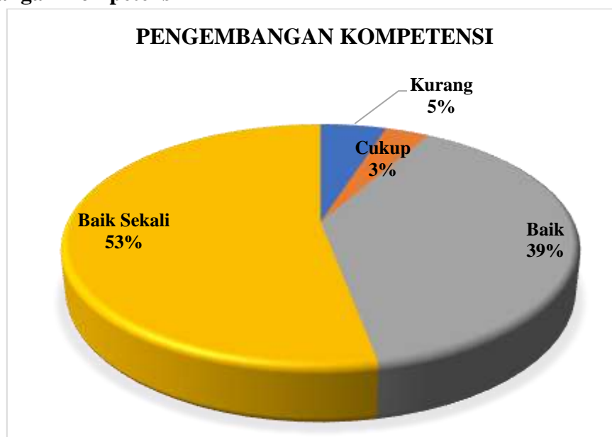
Diagram 3.1 Presentase Hasil Survei Kepuasan Tenaga Kependidikan terhadap Pengelolaan SDM Manajemen pada Aspek Pengembangan Kompetensi

Berdasarkan Diagram 3.1 di atas dapat dilihat bahwa Tenaga Kependidikan yang memberikan nilai Baik Sekali sebanyak 53% dan Baik sebanyak 39%. Nilai terbanyak terdapat pada poin 1 : Mendapatkan informasi mengenai tugas pokok dan fungsi pada saat pertama kali bekerja dan poin 3: Kesempatan untuk melakukan pengembangan diri melalui kursus/pelatihan/Seminar/Workshop dalam kampus. Tenaga Kependidikan memberikan penilaian Cukup sejumlah 3% dan nilai kurang sejumlah 5% pada aspek ini. Sehingga pada aspek Pengembangan Kompetensi berada pada kategori Baik Sekali .