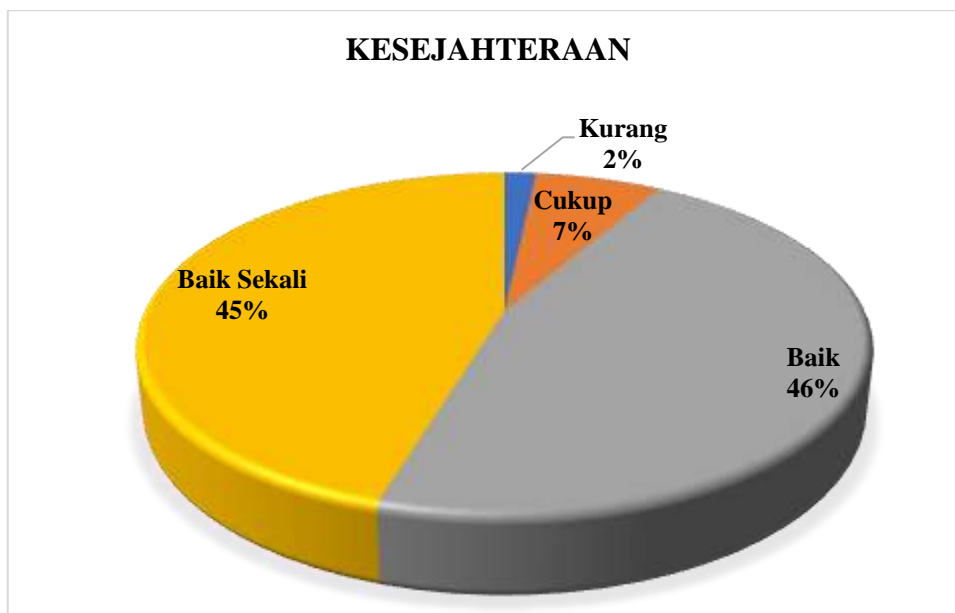
Diagram 3.3 Persentase Hasil Survei Kepuasan Tenaga Kependidikan terhadap Pengelolaan SDM Manajemen pada Aspek Kesejahteraan