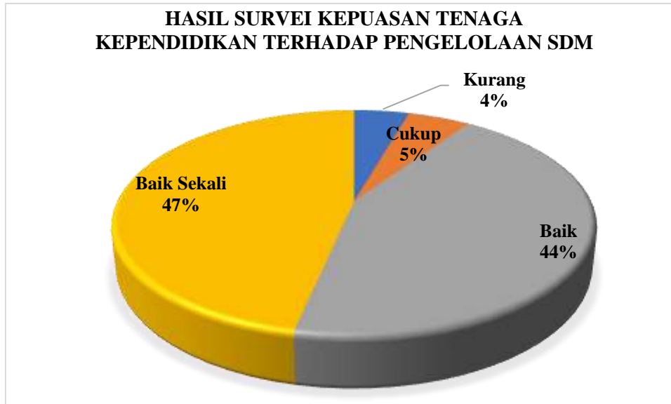
Diagram 4.1 Persentase Hasil Survei Kepuasan Tenaga Kependidikan terhadap Pengelolaan SDM Prodi Manajemen

Berdasarkan hasil survei dapat dilihat pada Diagram 4.1 yang menggambarkan bahwa secara keseluruhan Tenaga Kependidikan program studi Manajemen memberikan nilai Baik Sekali sejumlah 47%, nilai Baik sejumlah 44%, nilai Cukup sejumlah 5%, nilai kurang 4%. Jika merujuk pada Tabel 2.3 nilai persentase tersebut berada pada rentang 41-60%, sehingga dapat disimpulkan bahwa kepuasan Tenaga Kependidikan terhadap Pengelolaan SDM di program studi Manajemen masuk pada kategori CUKUP BAIK .